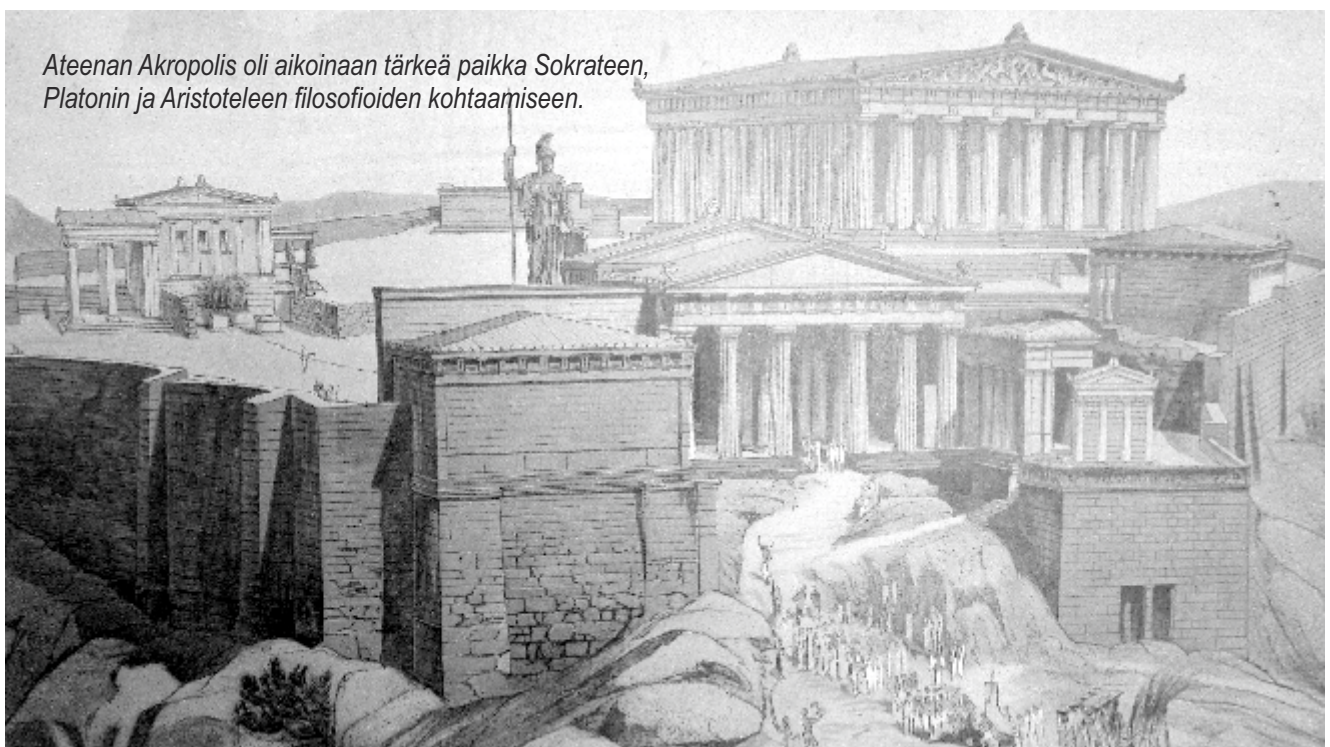
Ateenan Akropolis oli aikoinaan tärkeä paikka Sokrateen, Platonin ja Aristoteleen filosofoiden kohtaamiseen.

Tästä syystä on selvää, miksi Aristoteleen mukaan kussakin tilanteessa tulee olla yksi toiminta (vrt. NE 1106b28–35). Kussakin tilanteessa oikea toiminta on se, johon hyvä ihminen päätyy (NE 1113a29–33). Myös kasvatuksessa on harjoiteltava käyttäytymään sillä tavoin kuin hyvät ihmiset toimivat (NE 1105b5–12).